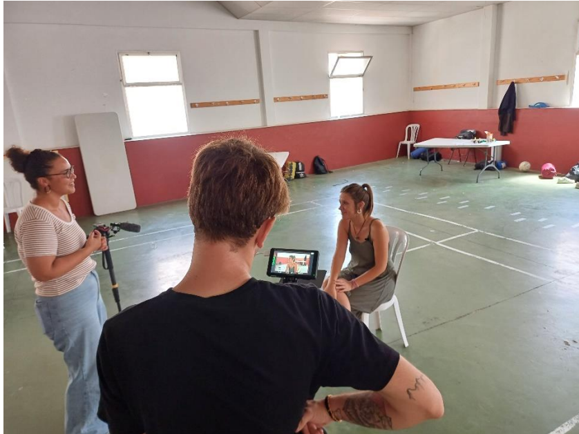
Imatge 6. Set de rodatge a Forcall. Entrevista a tècnica