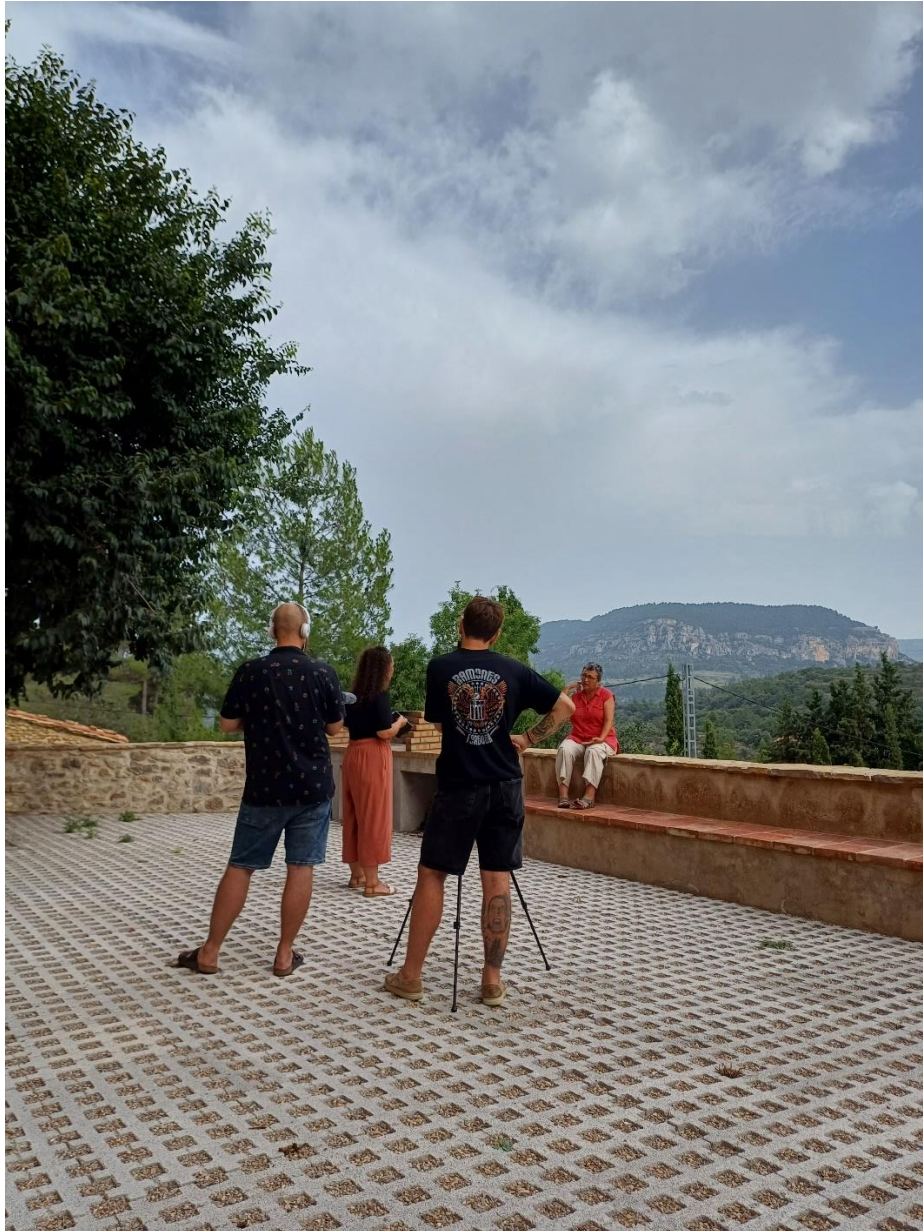
Imatge 2. Set de rodatge impulsora Consell Obert Villores

Data de realització: 11 de juliol de 2023