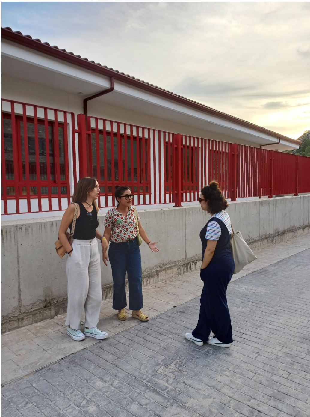
Imatge 10. Tres membres de la Plataforma Fem Escola davant de la nova escola rural

Data de realització: 27 de setembre de 2023