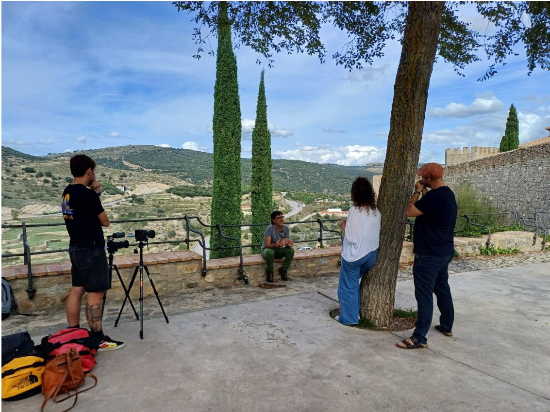
Imatge 7. Set de rodatge a un dels membres de l'equip motor d'Alifara

Data de realització: 18 de setembre de 2023