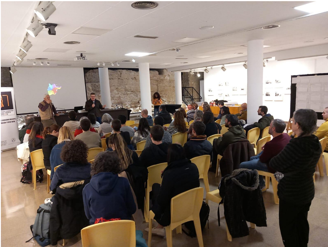
Imatge 15. Devolució final RIEPP