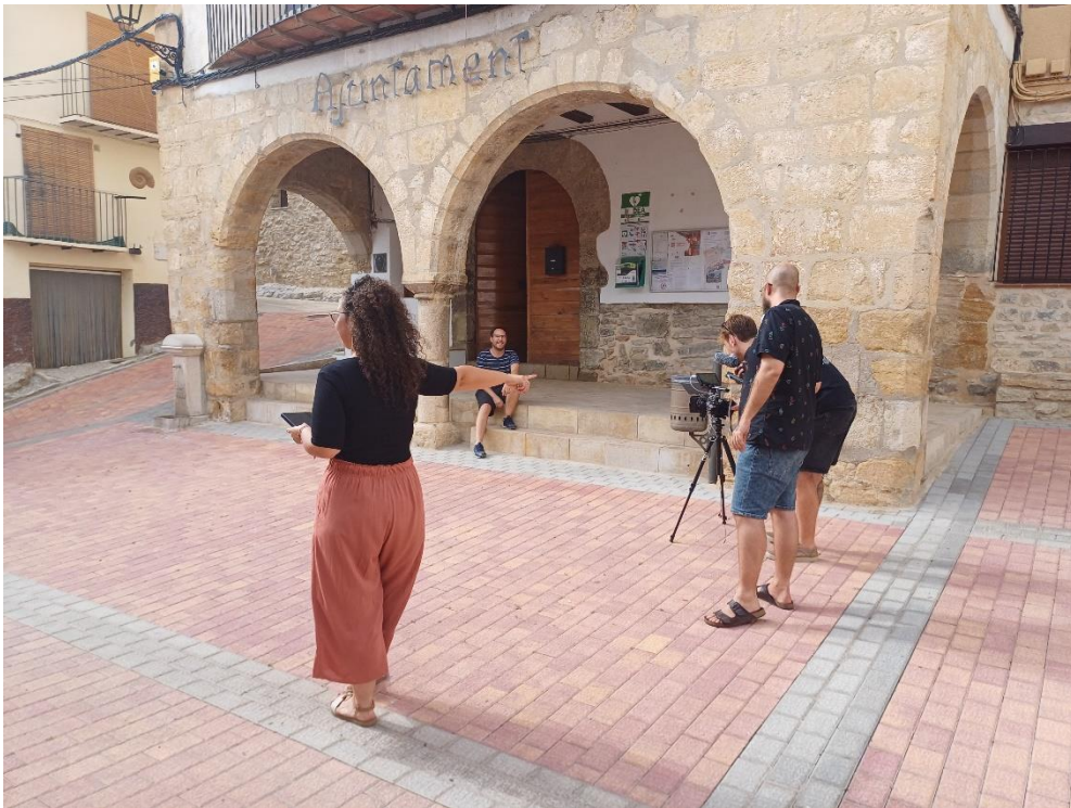
Imatge 4. Reunió inicial a l'Ajuntament de Villores