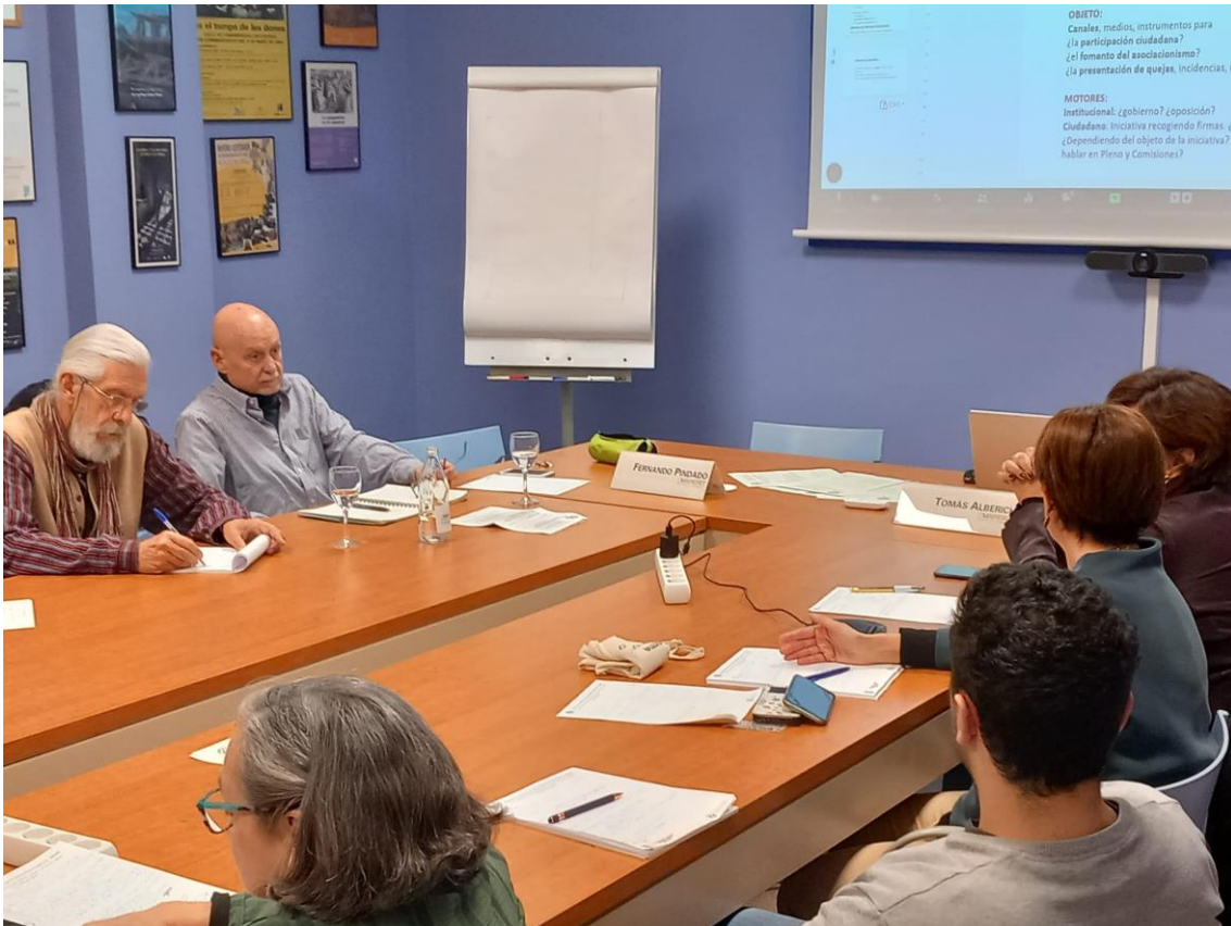
Imatge 13. Sessió de treball grupal a la RIEPP