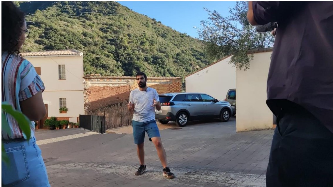
Imatge 9. Entrevista a un dels membres impulsors AlmedíjarVive

Data de realització: 22 de setembre de 2023