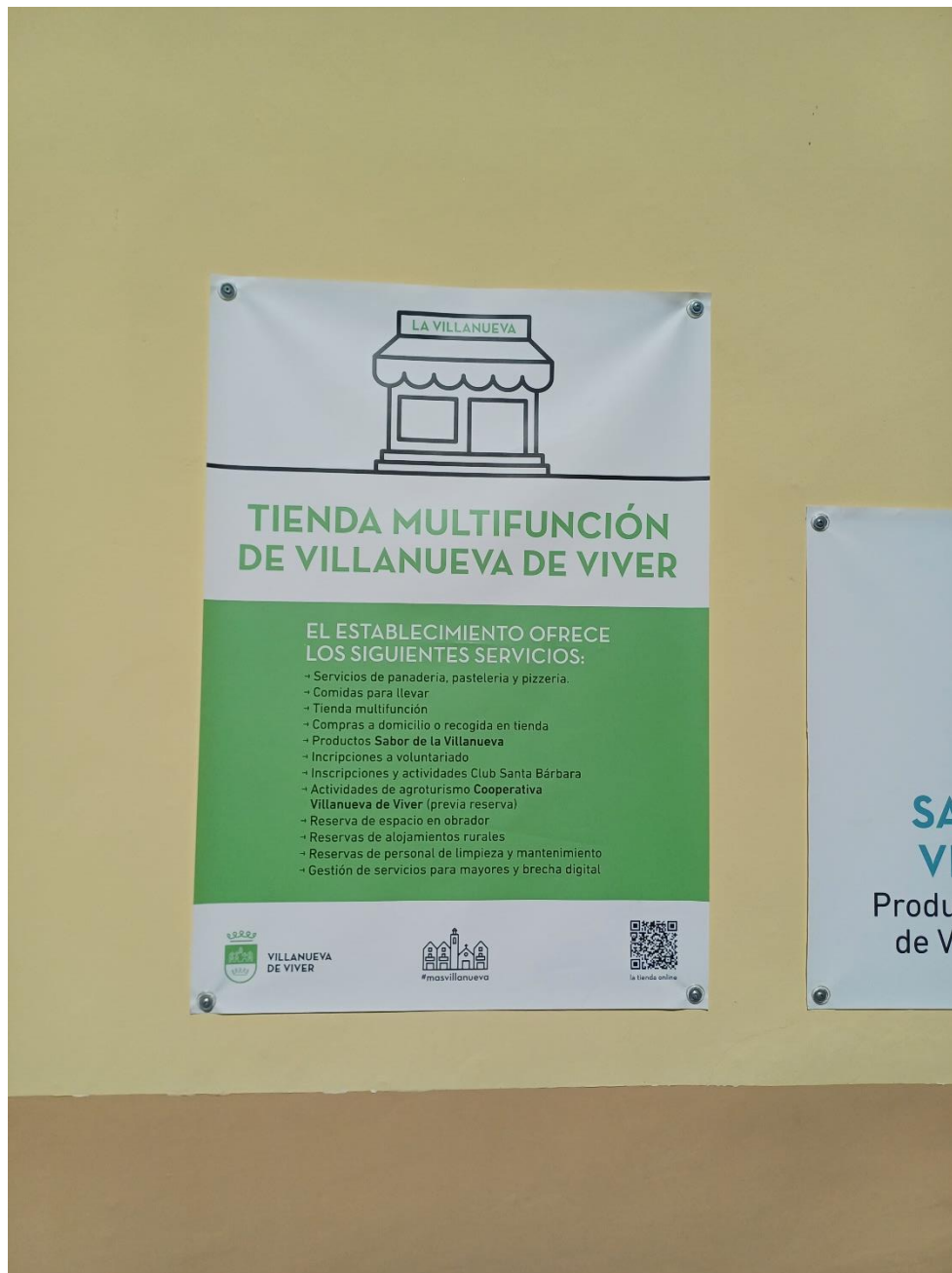
Imatge 8. Iniciatives rurals del Consell de Salut a Villanueva de Viver

Data de realització: 22 de setembre de 2023